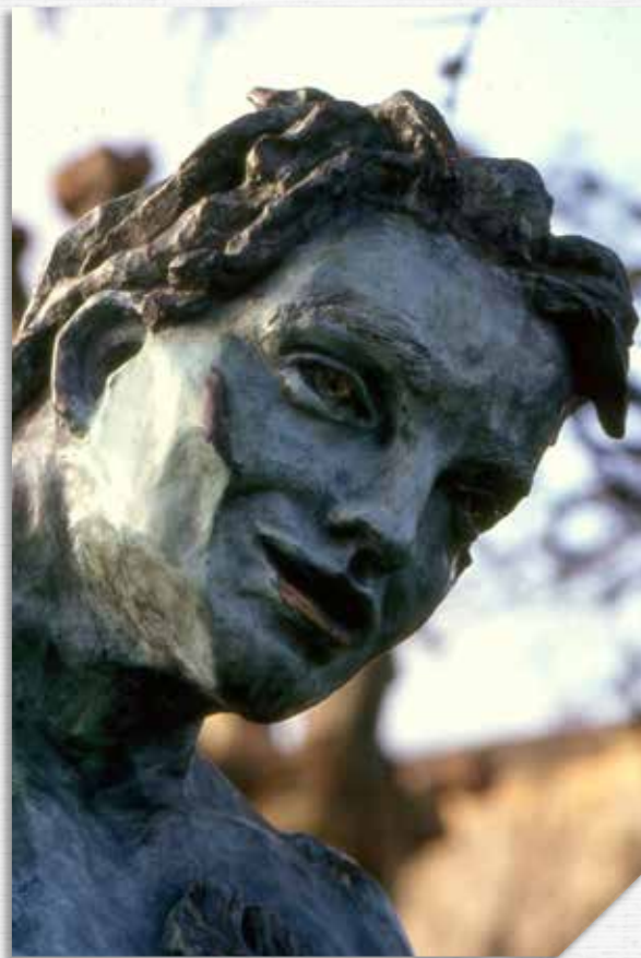
Bacchus 1990, Escale Bigata , Parc de Laurenzane à Gradignan