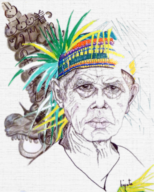
Lors d'une cérémonie religieuse sur la rivière à Gunek Bali - 2011