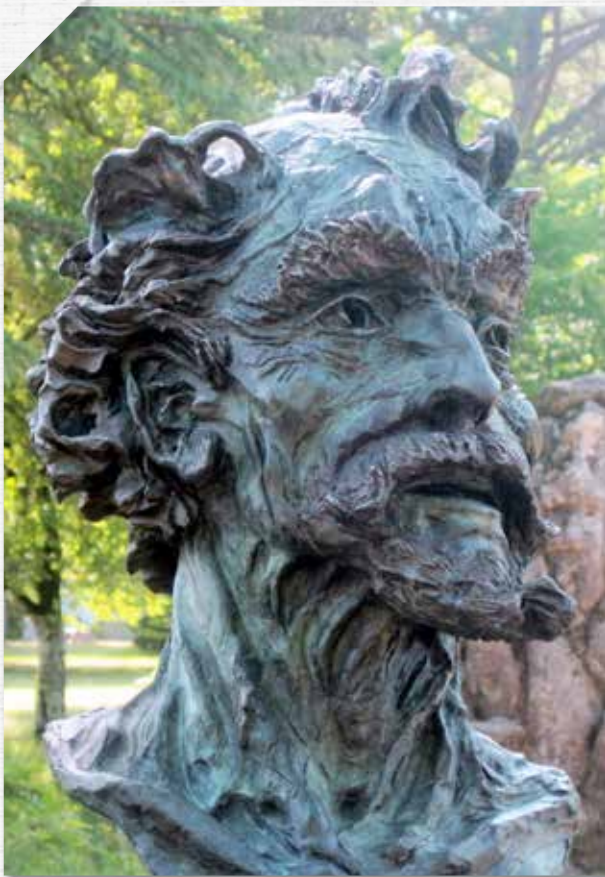
Don Quichotte Faunesque 2004, Escale Bigata , Parc de Laurenzane à Gradignan