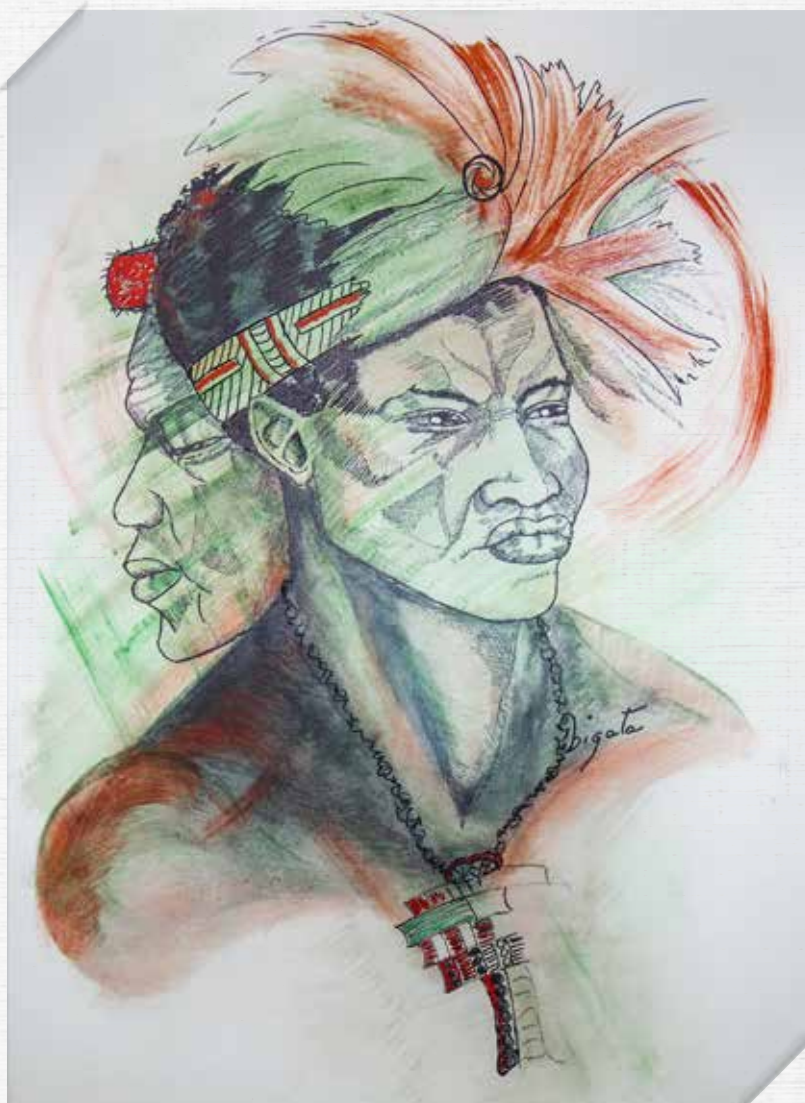
Zoulou Afrique du Sud - 2012