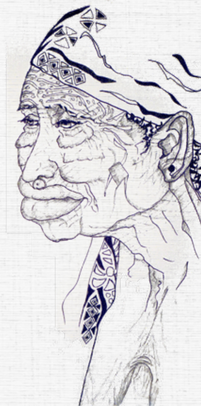
LOBI WOO WON

2011 - Carnet de Dessins « Face à Faces » - Editions La Part des Anges