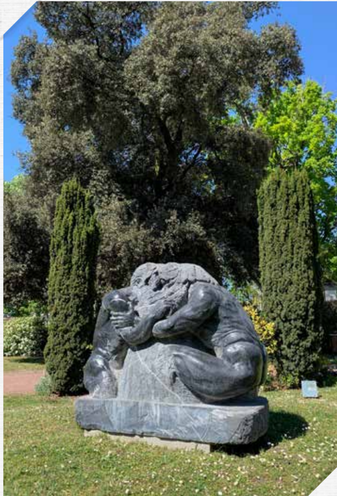
Gaïa, Terre des Hommes est à retrouver dans le musée à ciel ouvert : Escale Bigata, Parc de Laurenzane à Gradignan